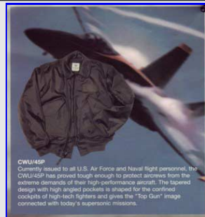
Bomber CWU45-P Vintage Made in USA